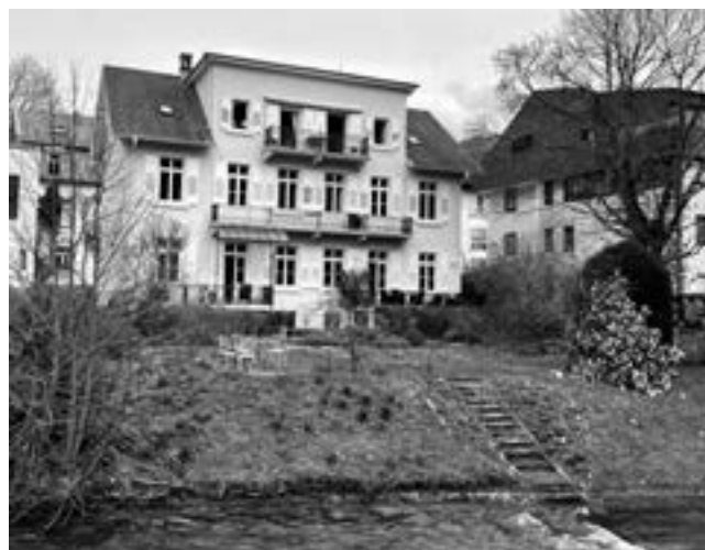
Claras Wohnhaus, Ansicht von der Straße und vom Garten aus. Das Dachgeschoss wurde erst in neuerer Zeit ausgebaut.