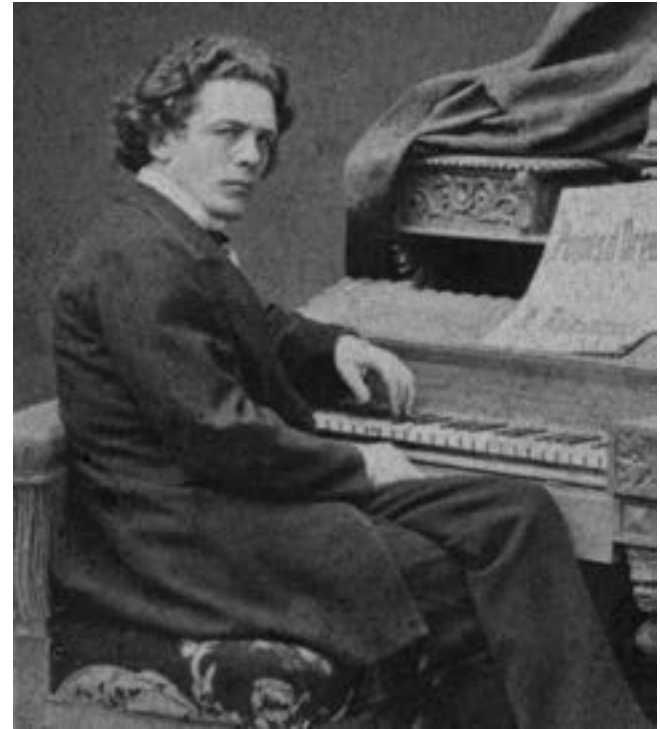
Porträt des Komponisten Anton Rubinstein (ca. 1860–1870).

»Wissen Sie, ich bin weder Fisch noch Fleisch. Den Juden bin ich ein Christ, den Christen ein Jude. Den Russen bin ich ein Deutscher, den Deutschen ein Russe, den Klassikern