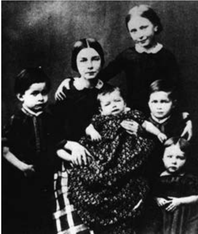
Robert und Clara Schumanns Kinder: Ludwig, Marie, Felix, Elise, Ferdinand, Eugenie (1855; Tochter Julie fehlt).

Felix und Eugenie gegenüber zu nachsichtig. Gerade kleine Kinder mussten streng angefasst, mussten zu Ordnung und Fleiß angehalten werden.