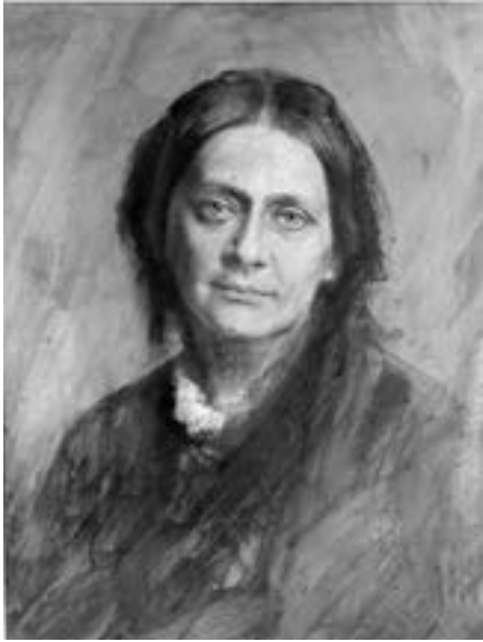
Clara Schumann (1878/79), Pastellzeichnung von Franz von Lenbach.