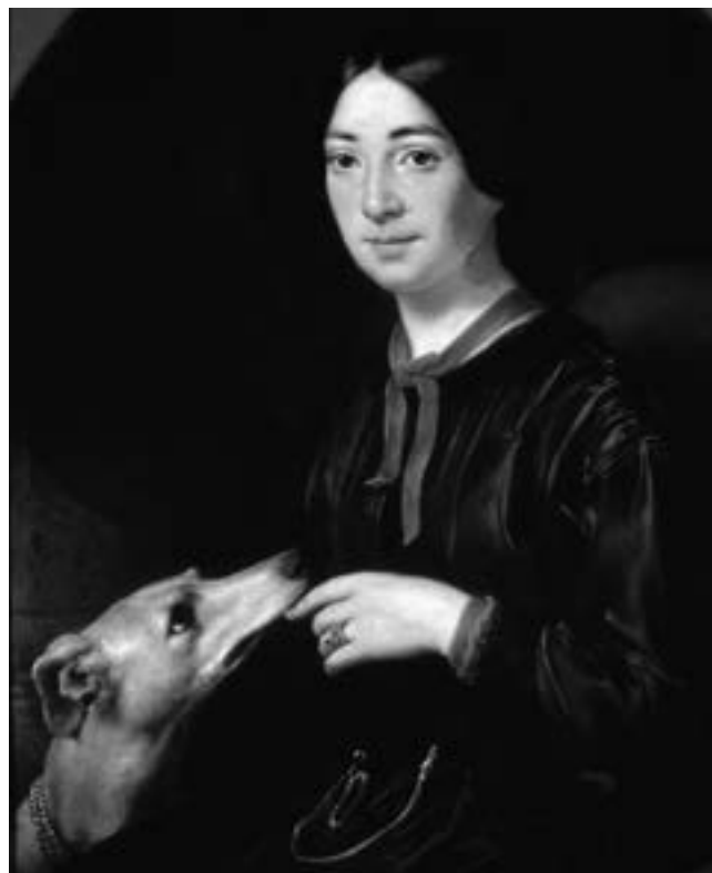
Pauline Viardot (1853). Gemälde von Eugène Pluchart.