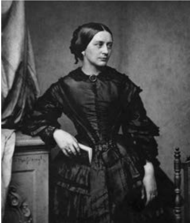
Clara Schumann (1857)