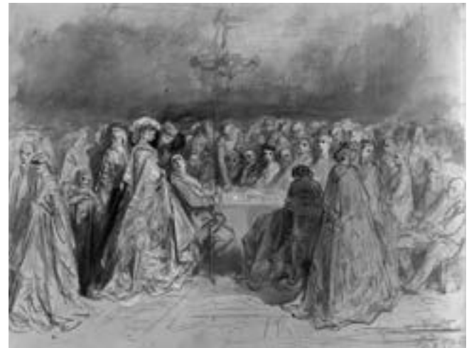
Pauline Viardot in Baden-Baden (1862), Gustave Doré