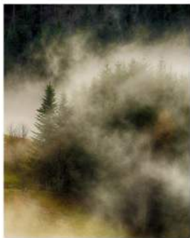
Schatten im Schwarzwald

Sophia schrie, als sie eine dunkle Gestalt über sich sah. Aber bevor sie etwas sagen konnte, fiel sie in Ohnmacht.«